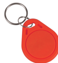
1 Stück aus Set von 50 Stück des Jetons SLZA 51R