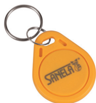
1 Stück aus Set von 50 Stück des Jetons SLZA 51