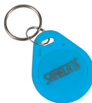
1 Stück aus Set von 50 Stück des Jetons SLZA 51B