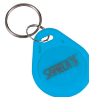
1 Stück aus Set von 50 Stück des Jetons SLZA 51B