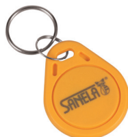
1 Stück aus Set von 50 Stück des Jetons SLZA 51