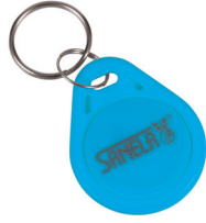
1 Stück aus Set von 50 Stück des Jetons SLZA 51B