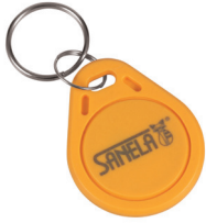
1 Stück aus Set von 50 Stück des Jetons SLZA 51