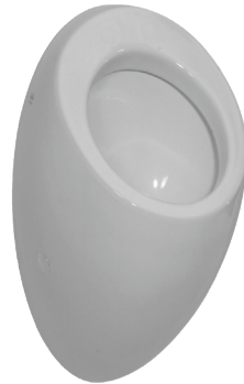
SLP 25 - ALESSI OHNE DECKEL