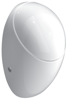
SLP 24 - ALESSI MIT DECKEL