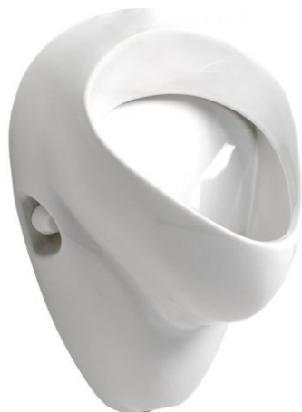
SLP 07 - NOVA PRO FELIX