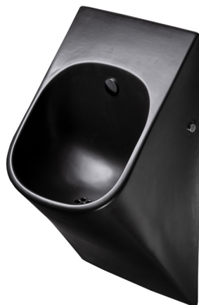
SLP 89S - LA FONTANA