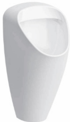
SLP 49 - CAPRINO PLUS RIMLESS