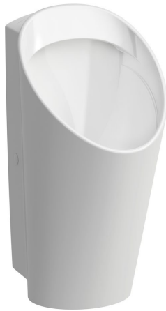
SLP 59 - LEMA RIMLESS