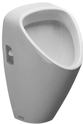
SLP 23 - CAPRINO