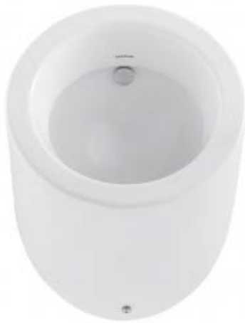
SLP 82 - WCA - Sanindusa