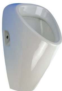
SLP 19 - GOLEM