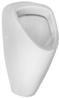
SLP 49 - CAPRINO PLUS