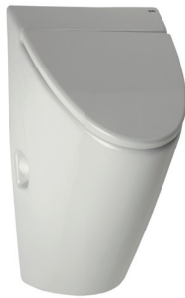
SLP 32 - ARQ MIT DECKEL