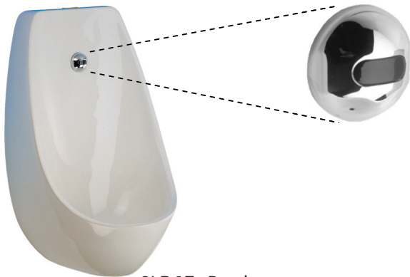
SLP 17 - Domino