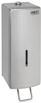
SLZN 73 85730 Edelstahl Flüssigseifenspender