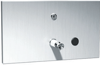
SLZN 62Z 95621 Edelstahl Flüssigseifenspender für Wandeinbau