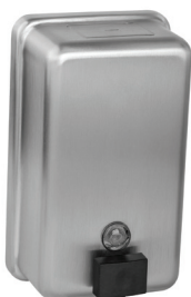
SLZN 39 95390 Edelstahl Flüssigseifenspender