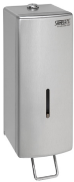
SLZN 73 85730 Edelstahl Flüssigseifenspender