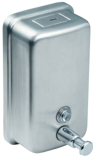
SLZN 05 95050 Edelstahl Flüssigseifenspender