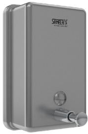
SLZN 39X 95392 Edelstahl Flüssigseifenspender