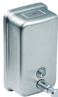
SLZN 07 95070 Edelstahl Flüssigseifenspender