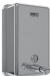
SLZN 39A 95391 Edelstahl Flüssigseifenspender