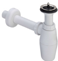
SLA 08 06080 Kunststoff-Siphon 5/4", zur Verwendung mit SLP 17