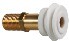
SLA 02 06020 Urinal - Zulaufstutzen