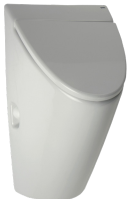
SLP 32 - ARQ MIT DECKEL