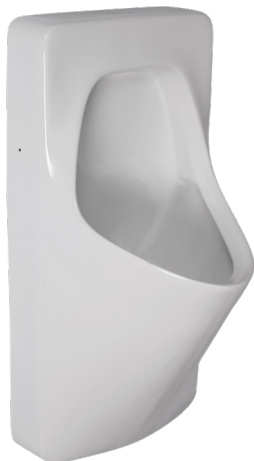
SLP 20 - ANTERO